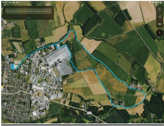
Hellblau: Reithallenrunde 6,7km