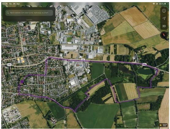
Lila: Bürgerwaldrunde 4,8km