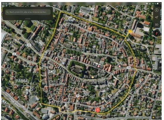
Gelb: Promenade 1,6km